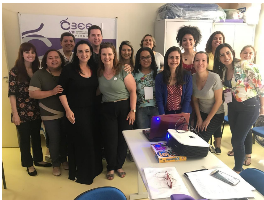
Minicurso de Tecnologia Assistiva (CBEE) – 2018