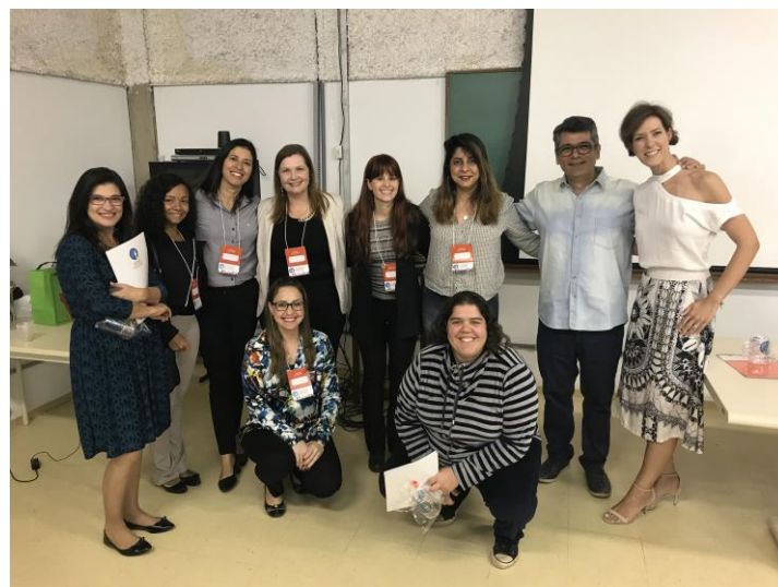
Curso de Aperfeiçoamento de Letramento para o Estudante com Deficiência (SEaD/Ed.Especial/Secadi-MEC) – 2017