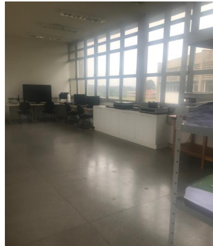
Parceria com o Núcleo de Formação de Professores (Sala de Acessibilidade) – 2018