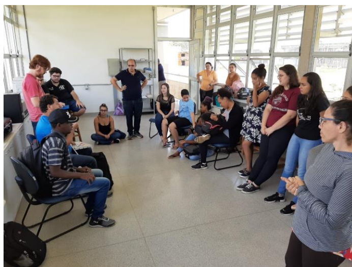
Aula de Tecnologia Assistiva para o alunos do curso de graduação em Educação Especial – 2019