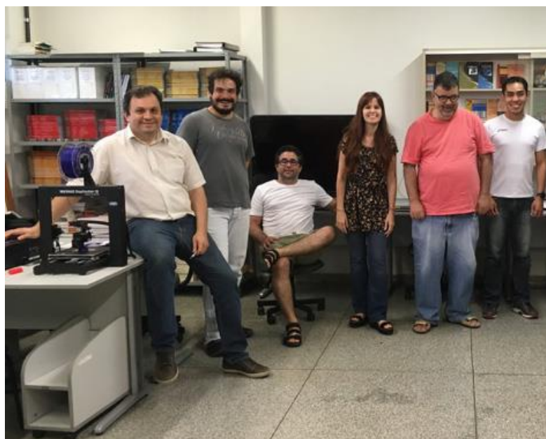
Parte da equipe do projeto Sistema de célula tátil para leitura braille - Edital de Inovação nº 3/2018 (CAPES) - Ferramentas de acessibilidade (SEaD-UFSCar) – 2019