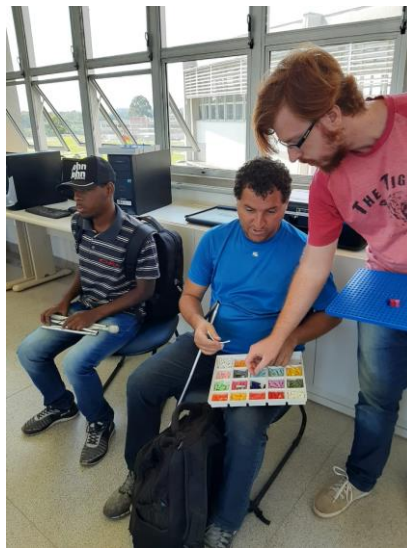
Aulas de matemática e de programação para alunos com deficiência visual – 2019

Algumas imagens dos trabalhos com Acessibilidade na UFSCar, realizados pelas Secretaria Geral de Educação a Distância e a Secretaria Geral de Ações Afirmativas, Diversidade e Equidade. Período 2012 a 2019.