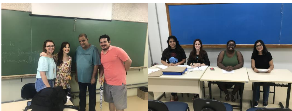
Matrícula UFSCar - Comissões de Ingresso (alunos com deficiência) – 2017/2018/2019