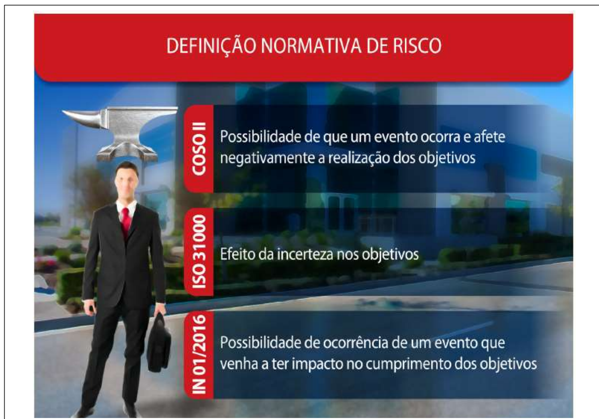
Figura 1- As três definições de “risco” nas normas

No artigo 2º inciso VIII da PGIRC-UFSCar, risco é a possibilidade de ocorrência de um evento que venha a ter impacto no cumprimento dos objetivos. O risco é medido em termos de impacto e de probabilidade.